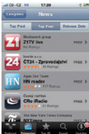
FOTO Stanice Z1 je první českou zpravodajskou televizí, která začala zdarma vysílat živě na telefonech iPhone

Společnost Mediawork z Vědeckého inkubátoru ČVUT vytvořila revoluční mobilní platformu, která dokáže jako jedna z prvních na světě zdarma přehrávat živé vysílání v mobilním telefonu typu iPhone. Podobnou službu nabízí držitelům mobilu z dílny Applu takoví mediální giganti, jako je CNN nebo BBC. V Česku je to ale rarita.