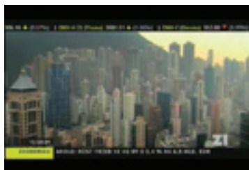
FOTO Záběr z živého zpravodajství